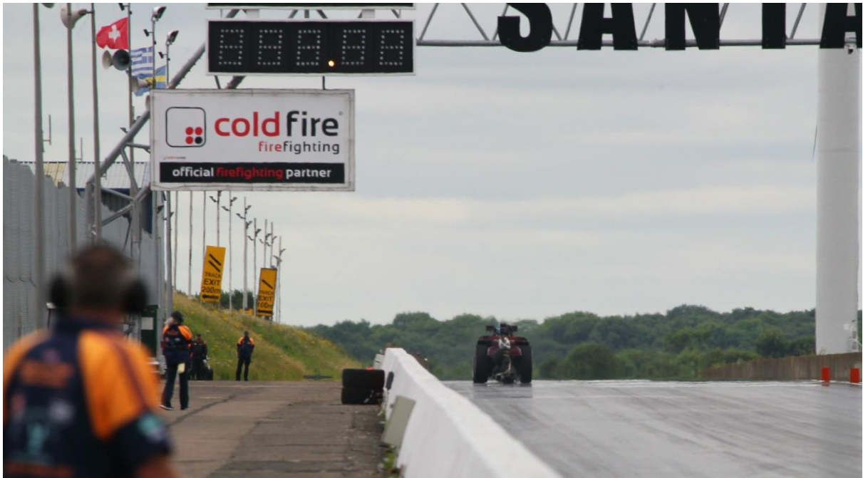
Taget precis före mållinjen. Ingen tid ännu. Om man zoomar in ser man att skärmen precis håller på att fyllas med luft.