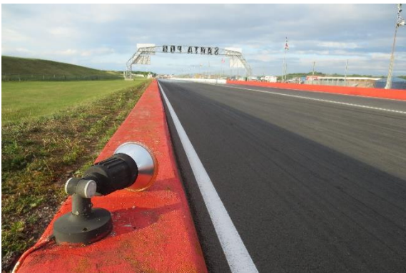
Höger bana: - Lampan sitter kvar.

En häftig bild som jag fick från en funktionär. Se pilen, där finns vinnarindikerings-lampan kvar. Hastigheten är c:a 250 km/tim. Några hundradels sekunder senare slungas den iväg med en sjuhelsikes fart rakt in i funktionärernas 4-hjuling. Hemma i garaget, i min låda med "offer till fartguden", har jag numera en glasbit från lampan som vi lyckade hitta. 😊