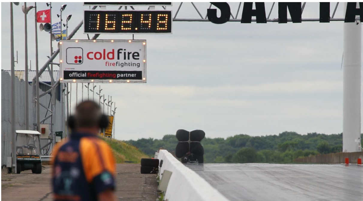
Mållinjen har passerats (se hastigheten på tavlan, 162 mph är c:a 260 km/tim) och skärmen har vecklats ut.